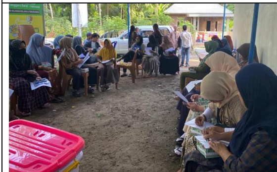
Gambar 3: Peserta Pelatihan Mencatat Materi