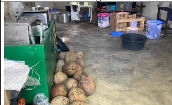
Gambar 4: Bahan dan Peralatan Pelatihan