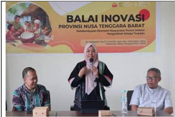
Gambar 1: Penyampaian Materi oleh Kepala Dinas Perindustrian Prov. NTB