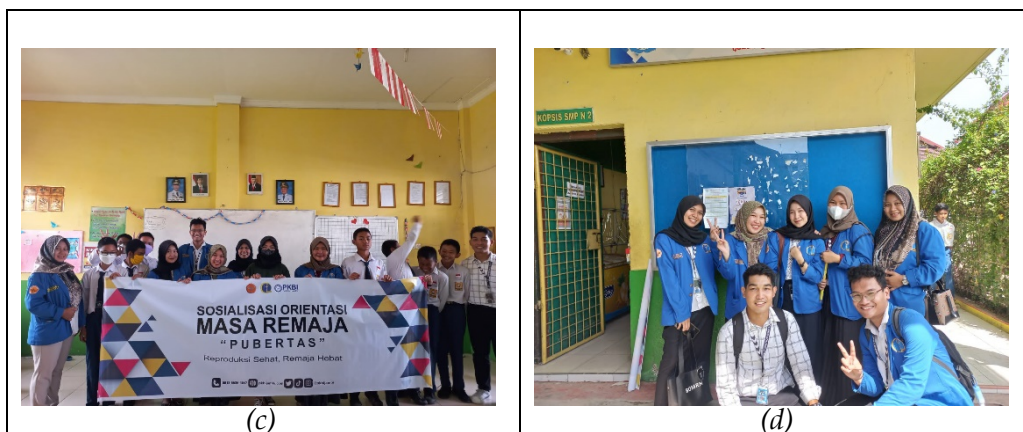
Gambar 1. Dokumentasi kunjungan sekolah (a) Siswa Kelas VIII G SMPN 02 Kota Jambi (b) Mahasiswa PLK-PLS BK Di depan Kantor Guru SMPN 02 Kota Jambi (c) Foto bersama Anak Kelas VIII G (d) Mahasiswa PLK-PLS BK selepas Kunjungan

Implementasi kegiatan ini dilakukan pada hari Selasa tanggal 21 November 2022 mulai pukul 08.00 WIB hingga pukul 12.00 WIB. Kegiatan Layanan Orientasi dilakukan secara luring Di SMPN 02 Kota Jambi. Peserta dari kelas VIII G adalah sebanyak 37 orang yang terdiri dari laki-laki dan perempuan. Mayoritas peserta berumur 13 dan 14 tahun. Namun pada saat pelaksanaan kegiatan dihadiri oleh 28 peserta. Selanjutnya hasil kegiatan dilaporkan kepada Koordinator Respond PKBI Daerah Jambi dan Fakultas Keguruan dan Ilmu Pendidikan Prodi Bimbingan dan Konseling Universitas Jambi.