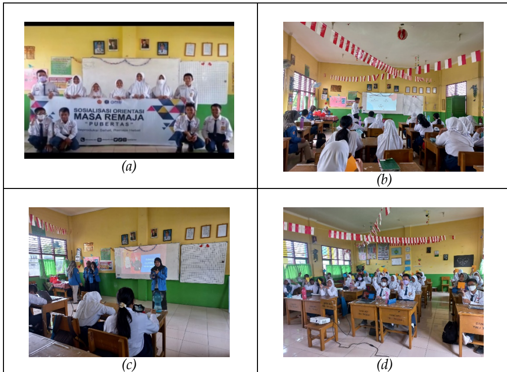
Gambar 2. Dokumentasi implementasi kegiatan (a) Pembukaan oleh Dekan FTI; (b) Paparan materi 1; (c) Paparan materi 2; (d) Pembagian doorprize

Pada akhir kegiatan diberikan formulir daftar hadir yang sekaligus berisi Kuisisioner singkat bagi peserta terhadap kegiatan layanan orientasi yang telah dilaksanakan. Hasilnya dapat dilihat pada Gambar 3.