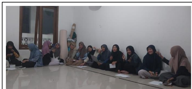
Gambar 1. Proses Diskusi dan Pembahasan Identifikasi Masalah dan Kebutuhan

Kegiatan ini diawali dengan identifikasi masalah. Mahasantri dikelompokkan menjadi lima kelompok. Fungsinya adalah untuk membentuk kelompok kerja yang mendiskusikan masalah dan tantangan dunia industri. Pemateri memberikan arahan hal apa saja yang dapat dijadikan rujukan dalam hal menyusun masalah.