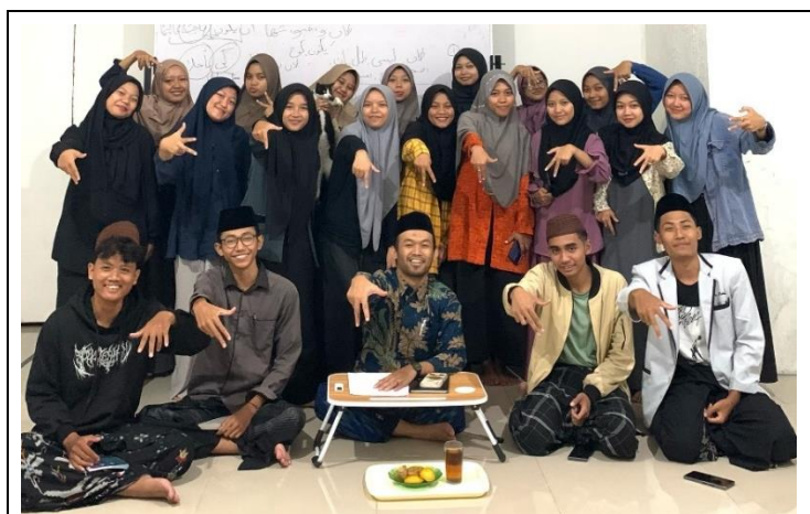
Gambar 3. Dokumentasi Diskusi

Kelompok terakhir memaparkan berkenaan dengan industri otomotif. Kelompok kelima berfokus pada inovasi anti lock braking system (ABS). sistem pengereman yang dibuat untuk menghindarkan kendaraan mengalami penguncian pada saat pengereman yang disebabkan pengereman mendadak atau permukaan jalan yang licin. Menurut kelompok terakhir, ABS adalah wujud nyata dari keberadaan intergasi penelitian dalam dunia industri.