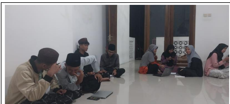
Gambar 2. Proses Finalisasi Integrasi Penelitian Dan Industri

mendorong inovasi dan adaptasi. AI hadir untuk memberikan kemudahan, namun tidak bisa dipungkiri bahwa investasi pada teknologi juga harus menjadi pertimbangan. Kedua, kelompok keempat memandang, pasar haruslah diberikan produk yang lebih fresh setiap waktunya. Kualitas produk perfilman tidak boleh mandeg, apalagi surut. Penelitian diharapkan mampu untuk memberikan gambaran soal hal baru setiap saatnya pada industri perfilman. Terakhir, menurut kelompok keempat penyampaian film atau periklanan haruslah menghadirkan penelitian agar pesan film dapat sampai. Iklan yang baik tidak semata berupa iklan, namun juga harus syarat makna yang mudah dan mengena di benak dan pikiran konsumen.